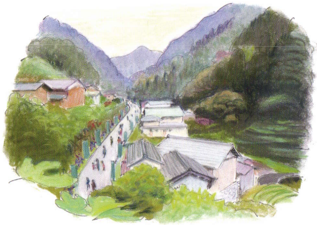
創造的交流で活気を取り戻した怒田沢集落のイメージ(吉田稔画)

怒田沢町は紅葉の名勝として知られる足助の香嵐溪から東へ5kmほど向かった、世帯数13世帯と言う山間の小さな集落です。いくつもの沢から湧き出た清流が町内を流れ、初夏には蛍が舞うそれはそれはのどかな山里です。