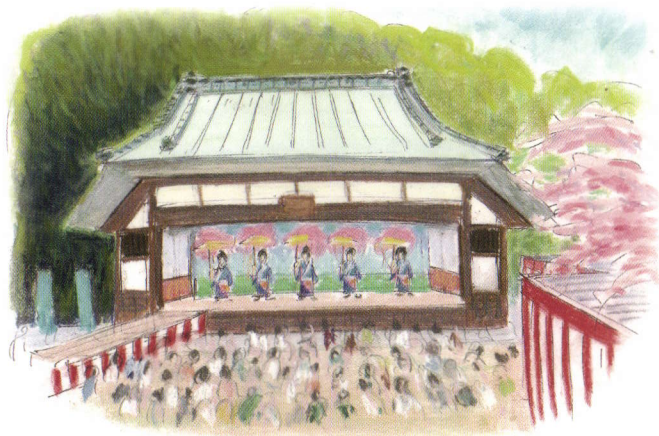
村歌舞伎に興じる農村舞台寶榮座のイメージ(吉田稔画)

怒田沢町諏訪神社農村舞台寶榮座は滞在型の楽屋を併設した市内唯一の舞台です。舞台は入母屋造りで棟札によると建てられたのは明治30年(1897年)。大正10年(1921年)に回り舞台にするなど大改修を行い、昭和35年(1960年)には萱葺屋根をトタンで覆い、現在に至っています。